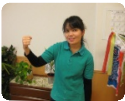
モンダン シティンザクさん

のいきごみを一言「まだ慣れていないことが多く、これから、色々頑張っていこうと思います。国家試験に合格できるように介護の知識や技術を頑張っています」