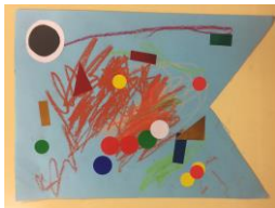
2歳児らっこ組 「なぐり描き・シール貼り」