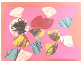
3歳児ぱんだ組 「のり付け、クレパス」