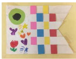
5歳児ぞう組 「はさみ、編み込み」