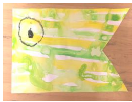
4歳児きりん組 「染め紙」