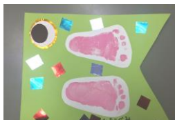
0歳児ひよこ組 「足形」

各クラスごと様々な材料や、技法を使った可愛いこいのぼりができあがりました。子どもたちの成長を願って、青空のもと元気に泳ぐこいのぼりの姿がありました。