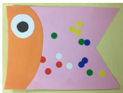
1歳児あひる組 「シール貼り」