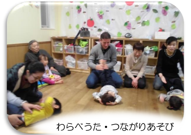
わらべうた・つながりあそび