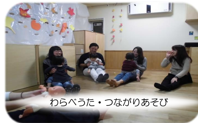
わらべうた・つながりあそび