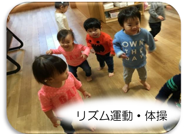
リズム運動・体操