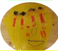
3・4歳児ほし・そら組