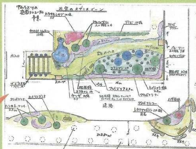
■植栽イメージ「天空のオアシスゾーン」