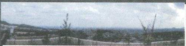
■屋上からの大阪平野の眺望