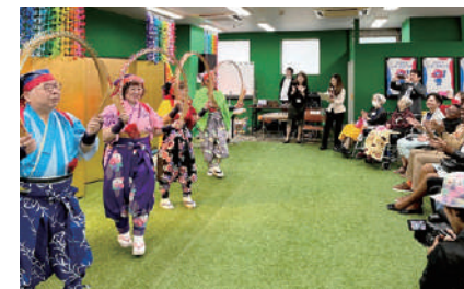
写真：大阪・関西万博2025『いのち輝く折り鶴JAPANパビリオン』 に、出展国視察ツアーの方が来訪

～世界中の皆様と折り鶴でつなごう笑顔の輪！～ ゆめ伴プロジェクト in 門真実行委員会