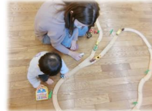
果物のシールを貼って タオル掛けを作りました!