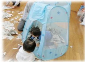
新聞紙のプールや テント気持ちいい♪