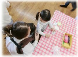
さかなにうろこ や目のシールを はりました!