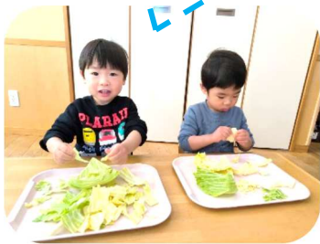
たくさんちぎれたよ!