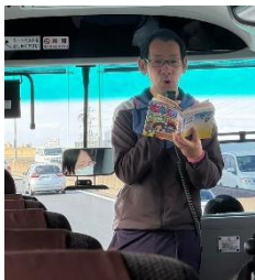
バスレク「なぞなぞ」

3月7日にそら組ゆめ組で、堺市のビックバンにおわかれ遠足に行きました。バスではレクリエーションとして行った「なぞなぞ」に、元気よく手を上げて答えようとする姿がありました。ビックバンに到着するとそれぞれのクラスに分かれ2F「電子動物園」では、自分で作ったイラストに色付け動かしたり3F「マチカネワニコーナー」では汗をかくほど楽しく体を動かし、4F「昭和30年コーナー」では昔懐かしの街並みコーナーの駄菓子屋でごっこ遊びをしたりとともだちと誘い合っあそんでいました。お弁当の時間には「おにぎりべんとう」を嬉しそうに友だちと見せ合って美味しくいただきました。午後からも残りのフロアを満喫し、保育園に帰ってからも「ワニのお腹の中が楽しかった」など、お話を聞かせてくれました。お家でもお話を聞いてみてください。お忙しい中、お弁当のご準備ありがとうございました。