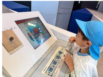
描いた絵が動いた！