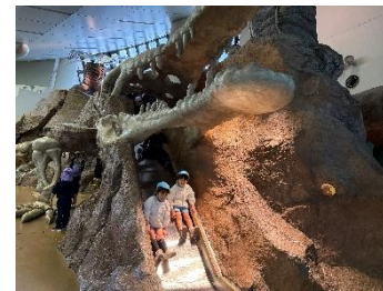
マチカネ ワニの 大冒険