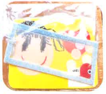
メダル (あさひ・ひかりくみから)