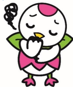
鶴見区のマスコットキャラクター つるりっぶ